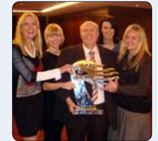
Reiner Calmund, Preisträger Health Media Award 2009