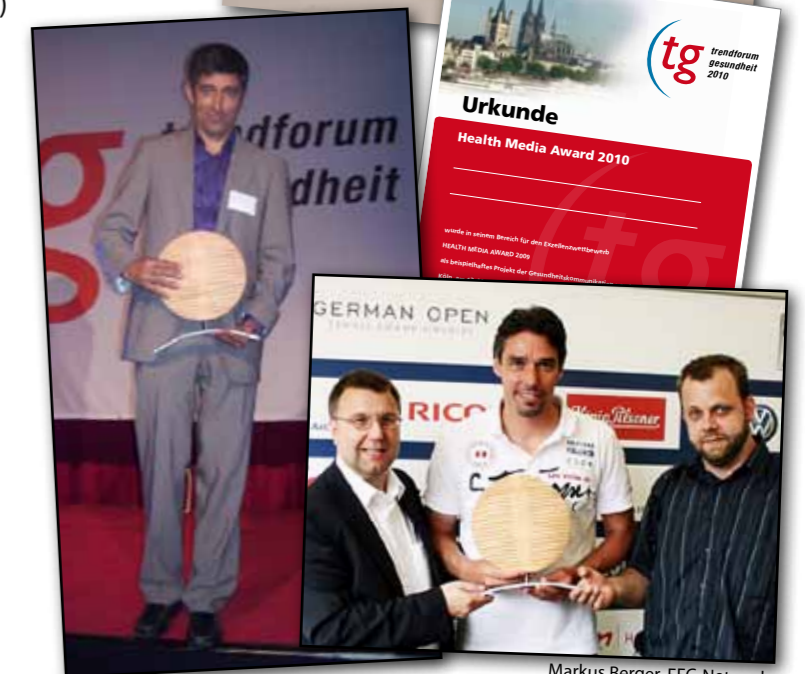
Preisträger Ranga Yogeshwar