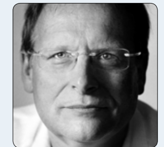
Prof. Dr. Dietrich Grönemeyer, Preisträger Health Media Award 2009