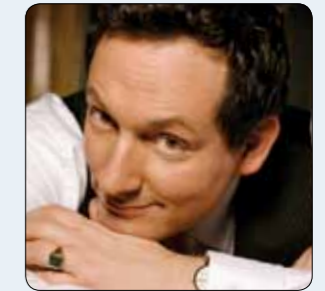
Dr. Eckart von Hirschhausen, Preisträger Health Media Award 2008